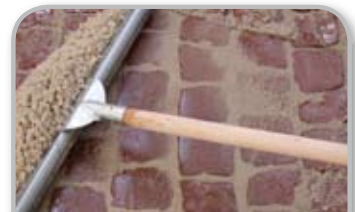
Skylles i med en gummiskaber