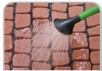
Gøre overfladen våd