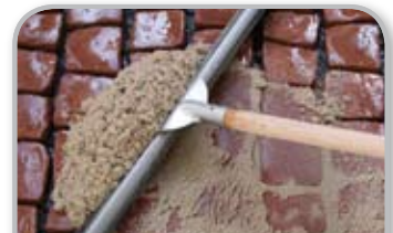
Arbejde i fugerne med en gummiskaber